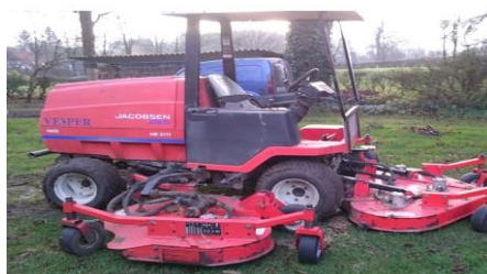
Jacobsen HR5111 Sichelmäher