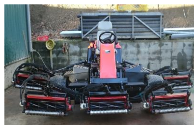
Jacobsen Fairway 405