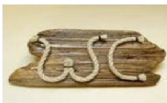
Text aus kleine Seilen